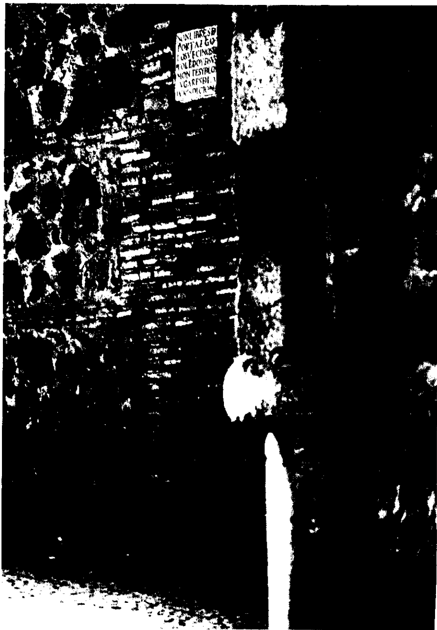
Lápida en la Puerta del Cambrón.