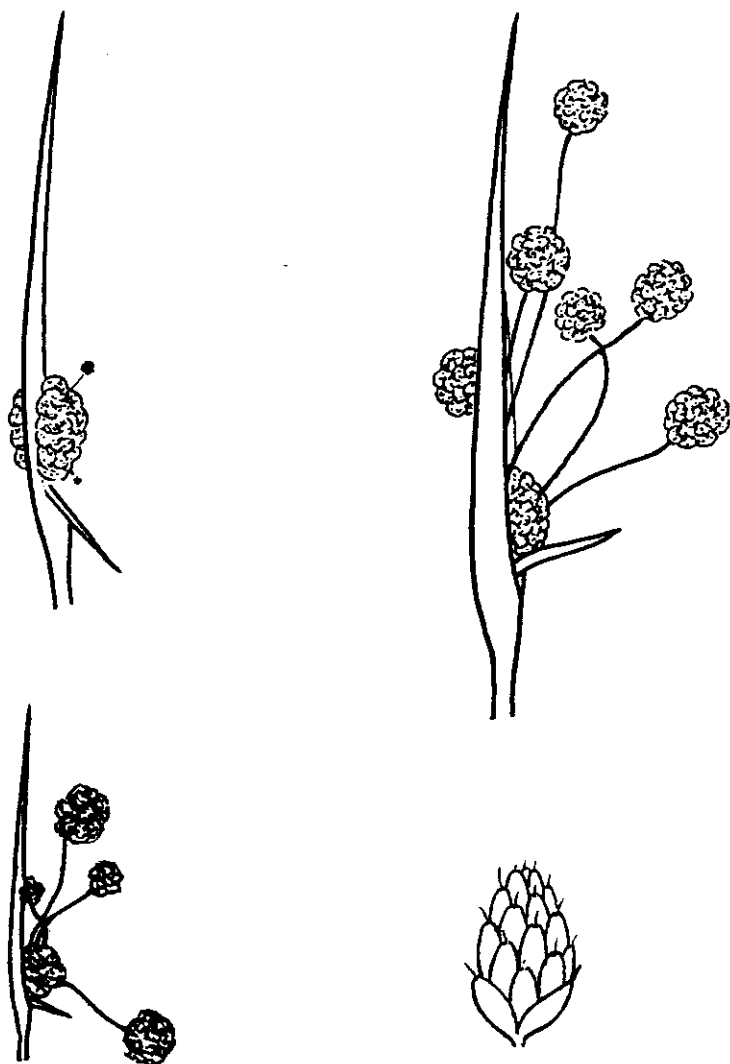
Fig. 2. Scirpus holoschoenus L., junco de bolitas. Se dibujan las tres formas más características que suele presentar su antela ( romanus , australis y vulgaris ) y se detalla la constitución de una de las espiguillas (abajo, a la derecha) que componen sus bolitas o cabezuelas. Estas tienen, en la madurez, el color de la herrumbre.