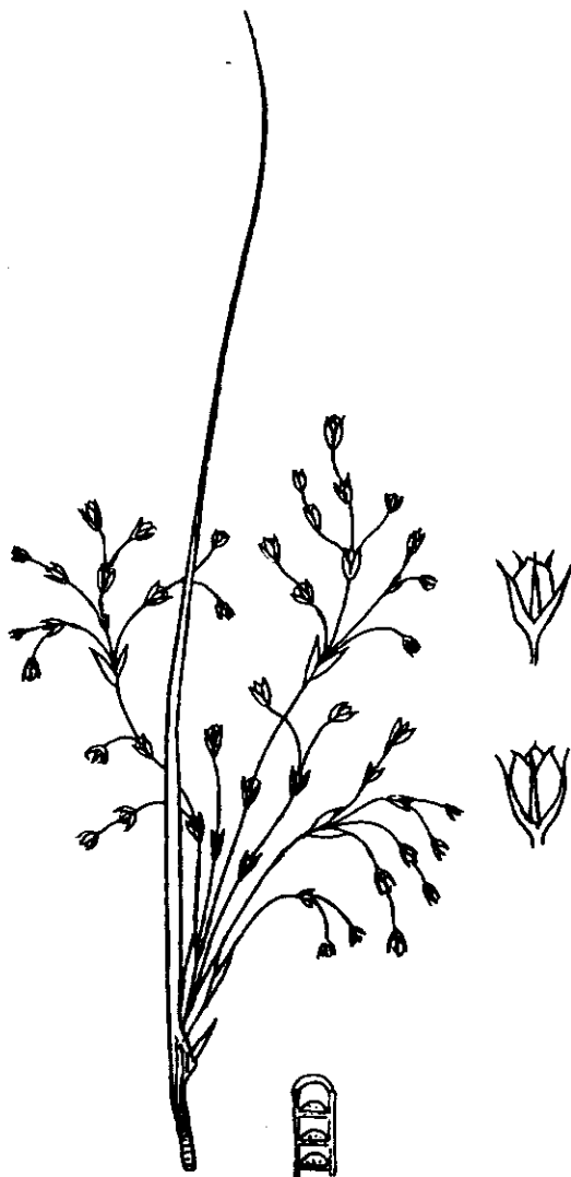
Fig. 4. Juncus inflexus L., el junquillo de YUCALITOS. Los principales caracteres que lo distinguen de Juncus acutus , además del tamaño menor, son los siguientes: tallos glaucos, mucho más delgados, finamente estriados y con la médula interrumpida; espata, más blanda y proporcionalmente más larga; antela, muchísimo más laxa y esquemática, y cápsulas, de la misma longitud que los tépalos, con los que presenta, por añadidura, un fuerte contraste cromático, ya que su color es castaño, mientras que el de los tépalos es crema claro.