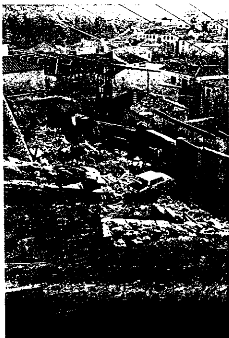
Casa y solar de lo que fue taller de Medrano.