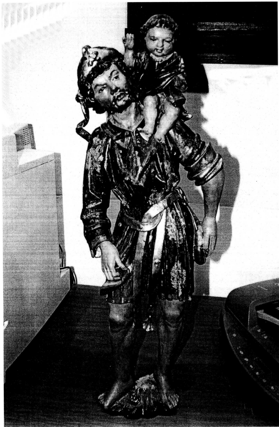
La talla restaurada de San Cristóbal con el Niño.