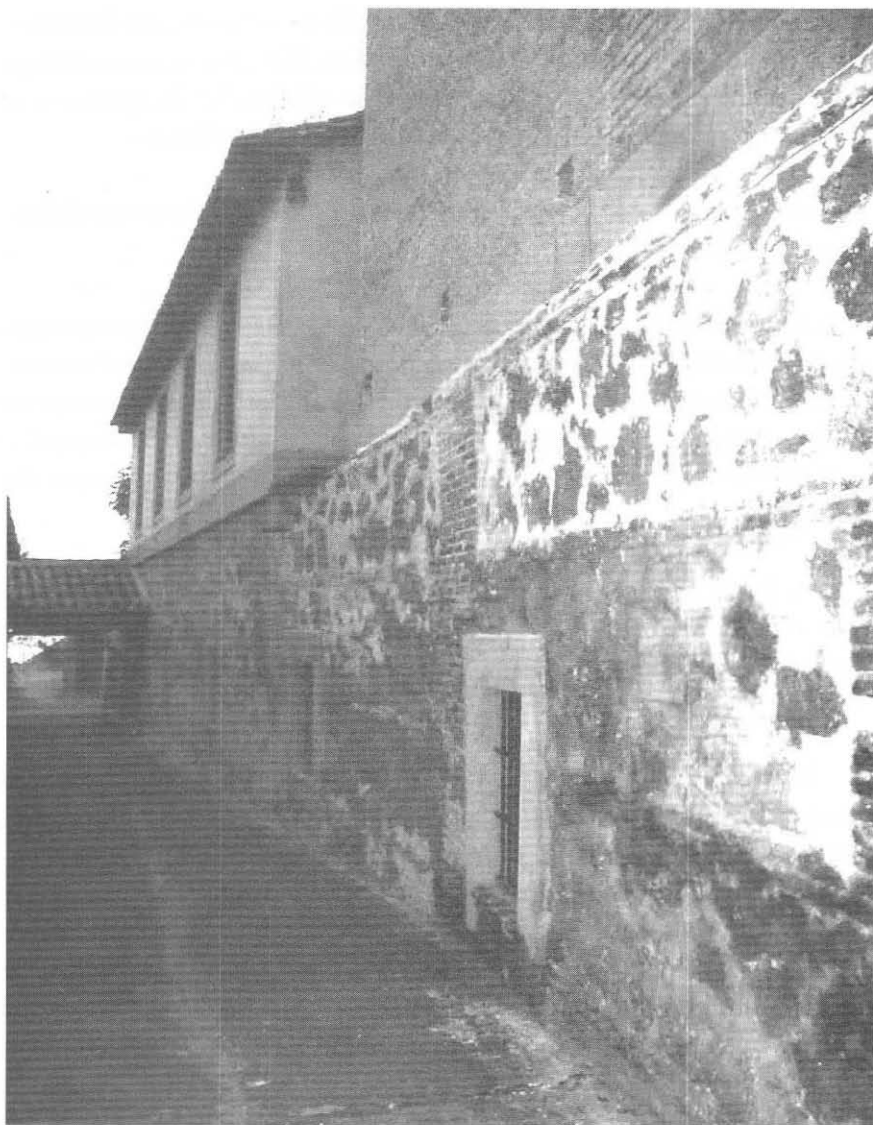
Figura 2.- La calle del Mármol, hoy privatizada, hacia la iglesia de San Juan de los Reyes y el cobertizo. A la derecha, se nota la planta baja de un cuerpo del segundo claustro (hoy desaparecido).