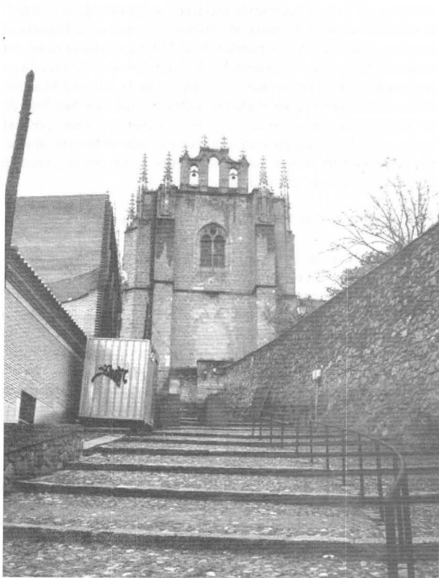
Figura 3.- La fachada oeste de la iglesia de San Juan de los Reyes vista desde la bajada al puente de San Martín.