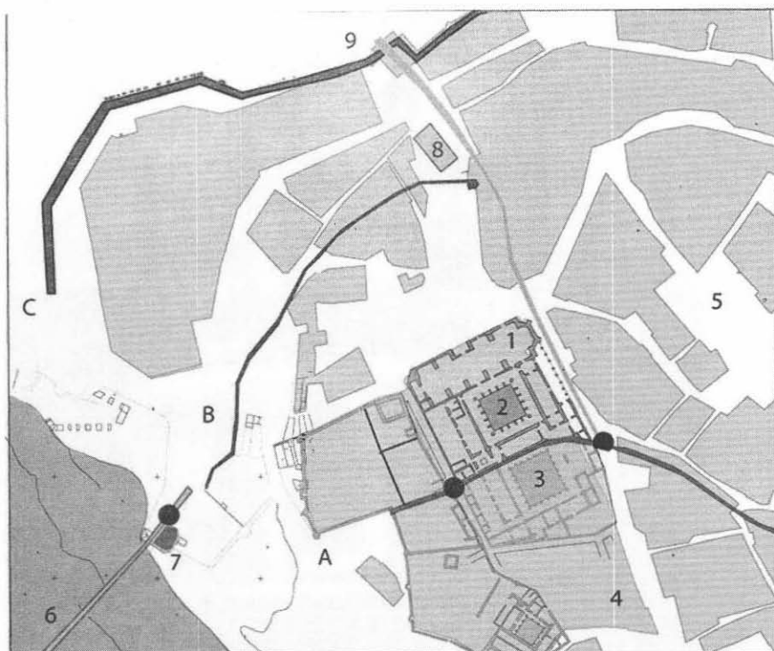
Fig 5. El convento de San Juan de Los Reyes en la primera mitad del siglo XVI