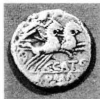
Fig. 2 Denario C. Porcius Cato Familia Porcia 137- 134 a.C.