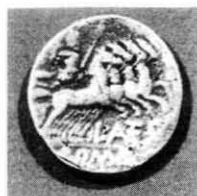
Fig. 1 Denario L. Cupiennius Familia Cupiennia 145- 138 a.C.