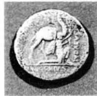
Fig. 6 Denario A. Plautius Familia Plautia 54 a.C.