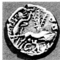
Fig. 4 Denario Sex. Pompeius Fostulus Familia Pompeia 133- 126 a.C.