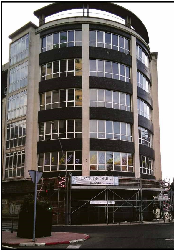
Edificio Tresku en 1952